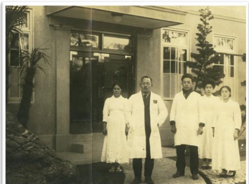
旧大道醫院 大道近蔵（左2人目：庄蔵の弟）1922年頃