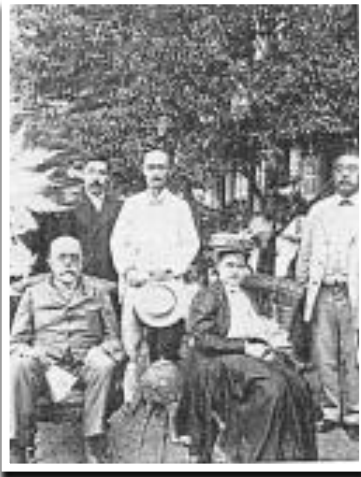
ロベルト・コッホ博士夫妻、北里柴三郎（右）、志賀潔（左）と江口襄（中央） (1908年 山田赤十字病院)